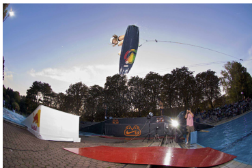
Daniel "Fetzy" Fetz

Der Erfolg des letztjährigen Red Bull Wake The Line hat sich in der gesamten Wakeboard-Welt schnell herumgesprochen. Deshalb geht der In-City Wakeboard- und Wakeskate-Contest mit Superstars aus der ganzen Welt am 1. Mai im Müngersdorfer Stadionbad in Köln in die zweite Runde. Vier durch Kicker und Rails verbundene Schwimmbecken ergeben 320 Meter Parcours, der mit dem Sesitec 2.0 System optimal ausgenutzt wird. Neue Obstacles und $10.000 Preisgeld locken internationale Top-Rider wie Shawn Watson (USA), Collin Harrington (USA), Leo Labadens (FRA) oder den 3-fachen Weltmeister Bernhard Hinterberger aus Oberaudorf (GER). Für das 24-köpfige Starterfeld werden bei der vorangehenden Warmup-Session in Langenfeld noch zwei Wildcards vergeben.