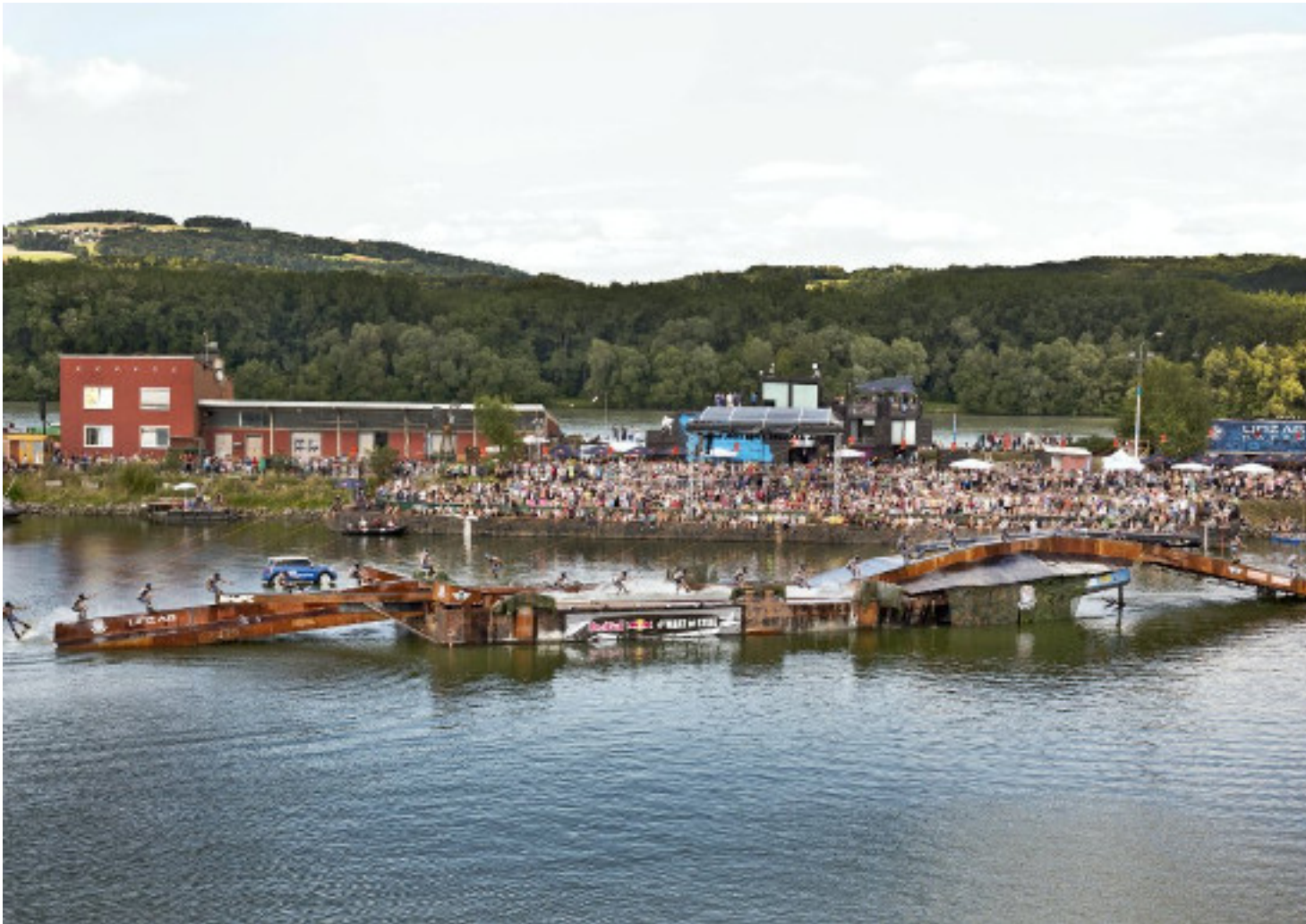
Das riesige Obstacle vor den Zuschauern im Linzer Handelshafen

Geschrieben von: Benjamin Wiedenhofer Dienstag, 12. April 2016 um 16:30 Uhr