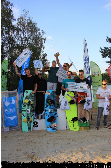
Die Gewinner des Contest sind im Bild zu sehen