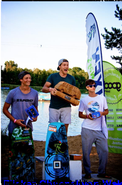
Die Gewinner des Contest sind im Bild zu sehen