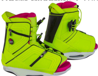
KISSON Bindung | Schnürsystem | OT | eher weicher Flex