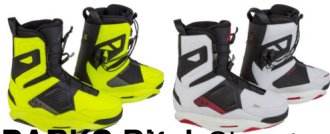
DARK Signature Boot | 2-Zonen-Schnürsystem | CT | mittlerer Flex | zwei Farbvarianten