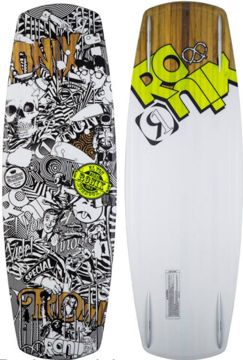
FRANK Bindungssystem | CT | mittlerer Flex | zwei Farbvarianten

Geschrieben von: Benjamin Wiedenhofer Donnerstag, 11. September 2014 um 16:00 Uhr