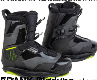
FRANK Bindungssystem | CT | mittlerer Flex | zwei Farbvarianten