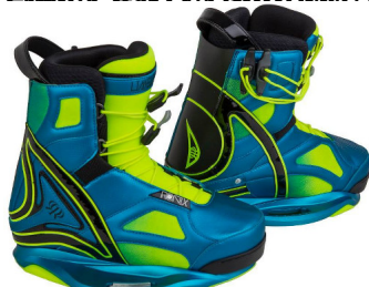
HAIZE Bindung | 2 Zonen-Schnürsystem | OT | mittlerer Flex