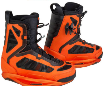
CODE 55 Bindungssystem | CT | harter Flex