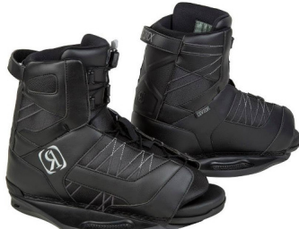
DISTANCE Bindung | OT | eher weichster Flex