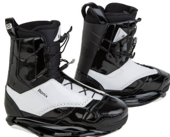
NETWORK Bindung | eher harter Flex