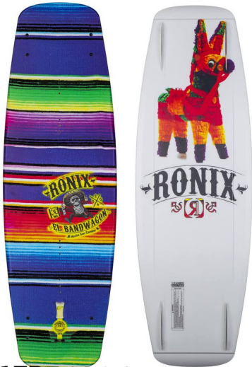
BOB 22 & 21 (Längen: 135, 139 & 143)

Geschrieben von: Benjamin Wiedenhofer Donnerstag, 11. September 2014 um 16:00 Uhr