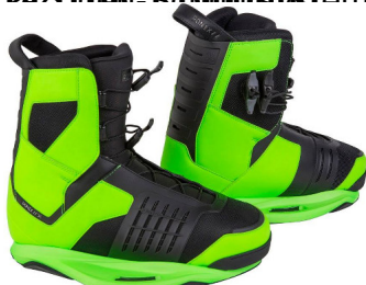
DMF LIGHT Bindung | Ladies Bindung | 2-Zonen-Schnürsystem | CT | eher weicher