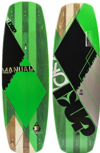
MANUAL (Sänger 134, 138 & 142) | Wood-Core | 3-Stage Rocker | ABS Rails |

Geschrieben von: Benjamin Wiedenhofer Freitag, 26. September 2014 um 18:00 Uhr