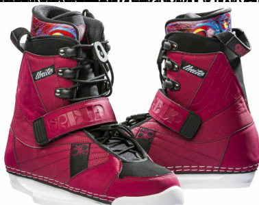
INITE R Boot für Mädele