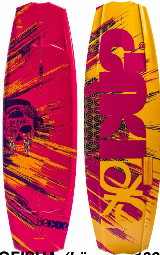
GEISHA (Längen: 133 & 137)