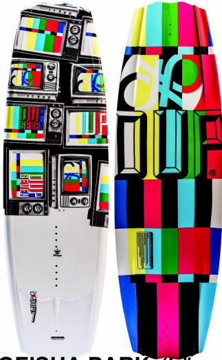
GEISHA DARK (Längen: 133 & 137)

Geschrieben von: Benjamin Wiedenhofer Freitag, 26. September 2014 um 18:00 Uhr