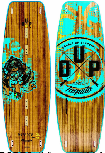
RODEO (Längen: 121 & 132)