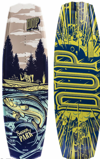
SEVEN (Längen: 133, 137 & 142)