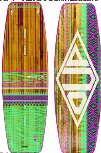
DUB (Längen: 138 & 144)