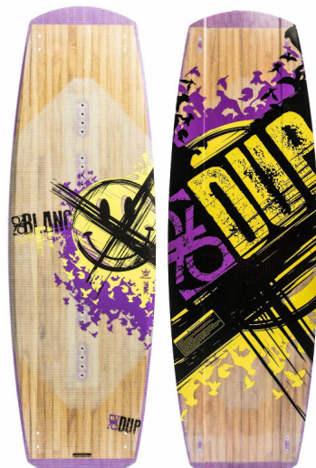
MANUAL (Sänger 134, 138 & 142) | steifere Flexzonen | Dyna Base