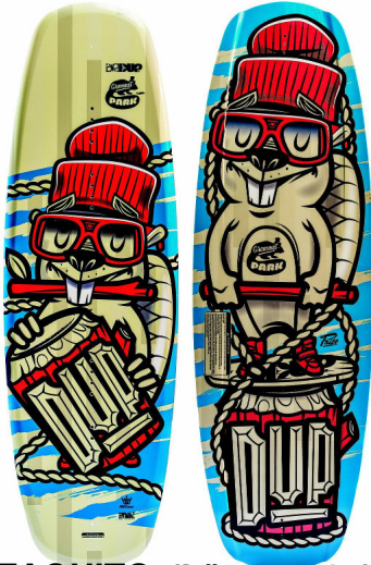
TACTIC (Längen: 126 & 128) neu für 2015

Geschrieben von: Benjamin Wiedenhofer Freitag, 26. September 2014 um 18:00 Uhr