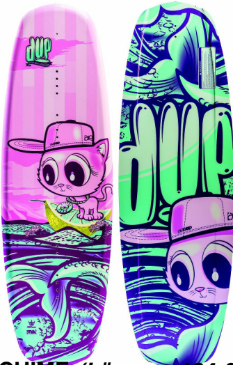
CHIME (Längen 121 & 132)

Geschrieben von: Benjamin Wiedenhofer Freitag, 26. September 2014 um 18:00 Uhr