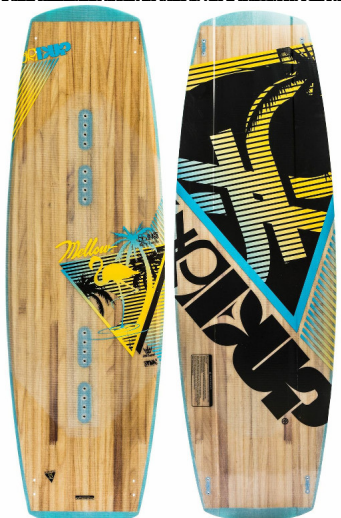
MANUAL (Sänger 137) | alle Mädels