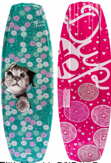
CHIME (Längen 121 & 132)