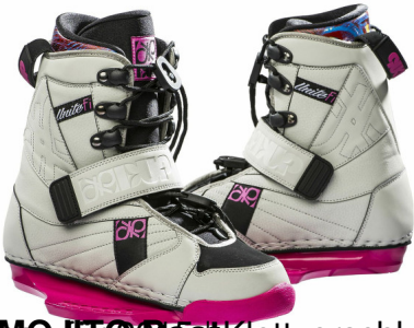
MOJITO Boot Klettverschluss | herausnehmbarer Innenschuh | CT