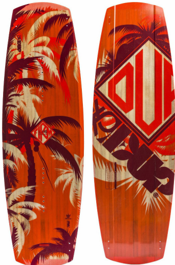
DEL TACO EL ANCHO (Längen: 136 & 142) Side Signature Board | Flex für 20 | Dynalite Core |

Geschrieben von: Benjamin Wiedenhofer Freitag, 26. September 2014 um 18:00 Uhr