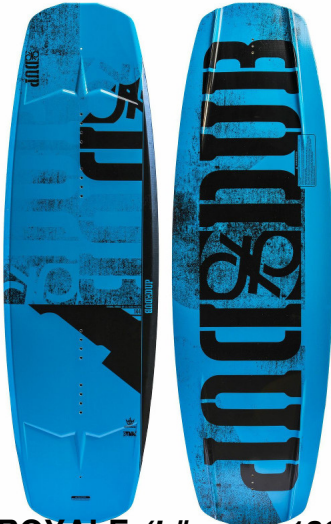
ROYALE (Längen: 136 & 140)

Geschrieben von: Benjamin Wiedenhofer Freitag, 26. September 2014 um 18:00 Uhr