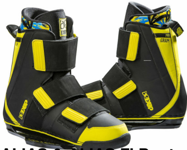
ALIAS & ALIAS FI Boot