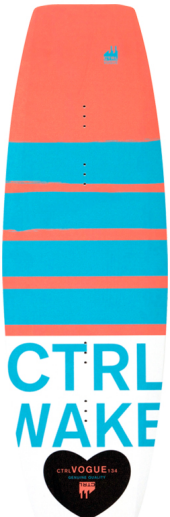
Neu im Programm: Die CTRL Wakeboards sind jetzt auch als Bindung erhältlich! (Längen: 129 & 134) | Hartholz Core | Blend Rocker | abriebsfeste Finnen durch