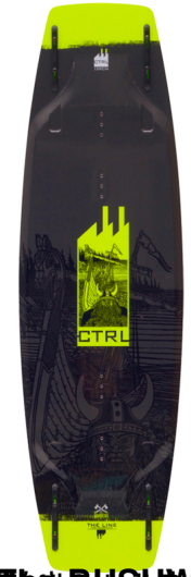
The BUSHWOOD (Länge: 134, 138 & 142) | Tuff Grind Base | Preßedee mit Carbon verstärktem Kern | Blend Rocker |