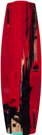
The HIKE (Längen: 136 & 141) | Hybrid Core | Blend Rocker | Tuff Grind Base

Geschrieben von: Benjamin Wiedenhofer Montag, 13. Oktober 2014 um 19:00 Uhr