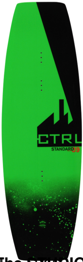
The CTRL Standard (Längen: 132 & 136) | Hartholz Core | Blend Rocker

Geschrieben von: Benjamin Wiedenhofer Montag, 13. Oktober 2014 um 19:00 Uhr