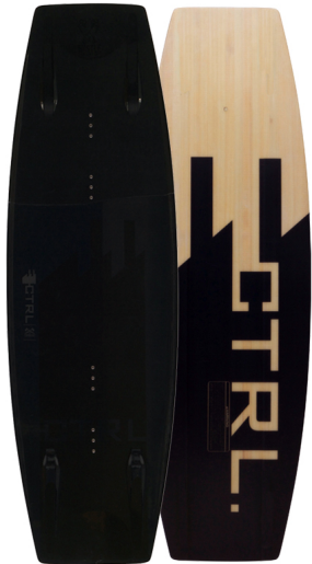
The SUPREME (Längen: 134, 138 & 142) |