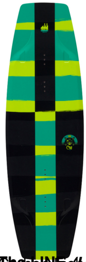
The BLIND (Länge: 135, 139 & 143) | Präßt | Tuff Grind Base