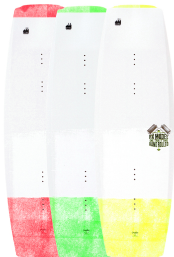
The STANDARD (Längen 129, 131 & 139) Core | Blend Rocker | abriebsfeste Finnen durch ABS Kunststoff