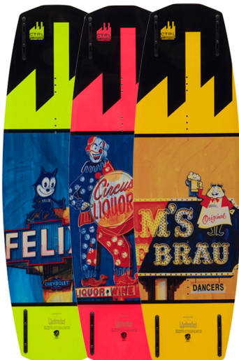
The SUPREME WOODY Park Edition (Längen: 137, 138 & 142) |