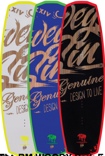
The REALITY (Länge: 135, 139 & 143) | Blend Rocker | Finnless

Geschrieben von: Benjamin Wiedenhofer Montag, 13. Oktober 2014 um 19:00 Uhr