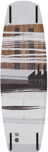
The BACKSTAGE (Längen 134 & 136) Core | Blend Rocker | Tuff Grind Base

Geschrieben von: Benjamin Wiedenhofer Montag, 13. Oktober 2014 um 19:00 Uhr